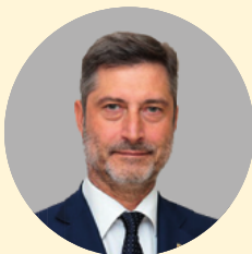
Junts 11 名议员