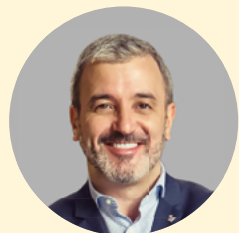
PSC 10 名议员