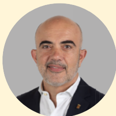
PP 4 名议员