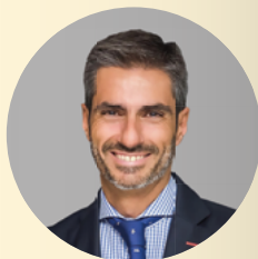
VOX 2 名议员